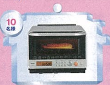
東芝 加熱水蒸気オーブンレンジ 石窯ドーム