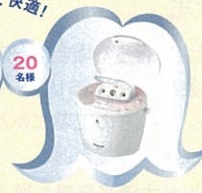
パナソニック スチーマーナノケア