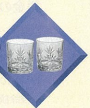
カガミクリスタル