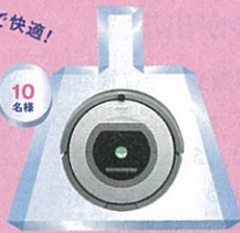
アイロボット ルンバ760