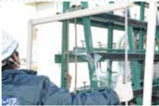
▲ 取付専用グレチャンによる施工

スペーシアの取り替え工事は、もともとのサッシを活かしてガラスを取り替えるだけなので、とても簡単です。スペーシアをサッシに固定する際、シーリング材の代わりに取付専用グレチャンが使える場合は、ガラス1枚あたり約30分で取り替えます。