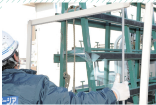
▲ 取付専用グレチャンによる施工

スペーシアの取り替え工事は、もともとのサッシを活かしてガラスを取り替えるだけなので、とても簡単です。スペーシアをサッシに固定する際、シーリング材の代わりに取付専用グレチャンが使える場合は、ガラス1枚あたり約30分で取り替えます。