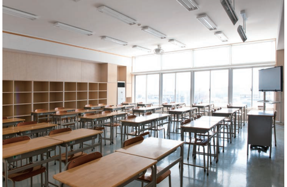
●横浜市立あかね台中学校(神奈川) 設計:みかんぐみ 施工:小俣・六国・日成建設共同企業体

※本表の数値は光学的及び熱的性能を示す一般的な数値であり、各製品の性能を保証するものではありません。