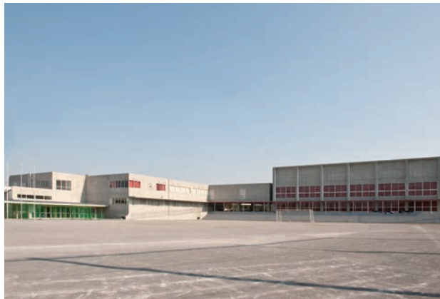
●横浜市立あかね台中学校(神奈川) 設計:みかんぐみ 施工:小俣・六国・日成建設共同企業体 スクールペアエコEA