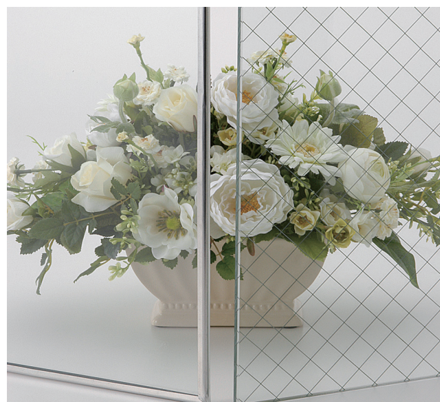
パイロクリア 6.5 ミリ