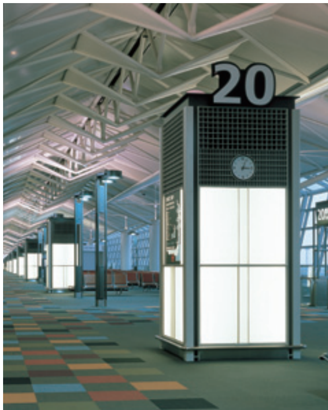
●中部国際空港(愛知) 設計:日建・梓・HOK・アラップ中部国際空港旅客ターミナルビル設計監理共同企業体 玄G-01

※この色調見本は印刷のため実際の色と多少異なります。ご採用の際にはサンプルによるご確認をおすすめします。