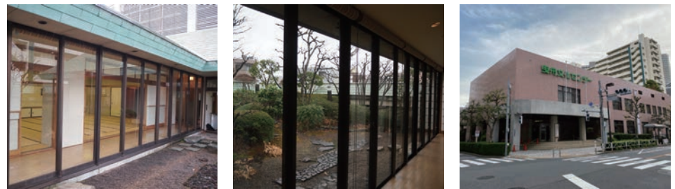
● 曳舟文化センター(東京)