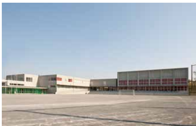
●横浜市立あかね台中学校(神奈川) 設計:みかんぐみ 施工:小俣・六国・日成建設共同企業体 スクールペアエコEA