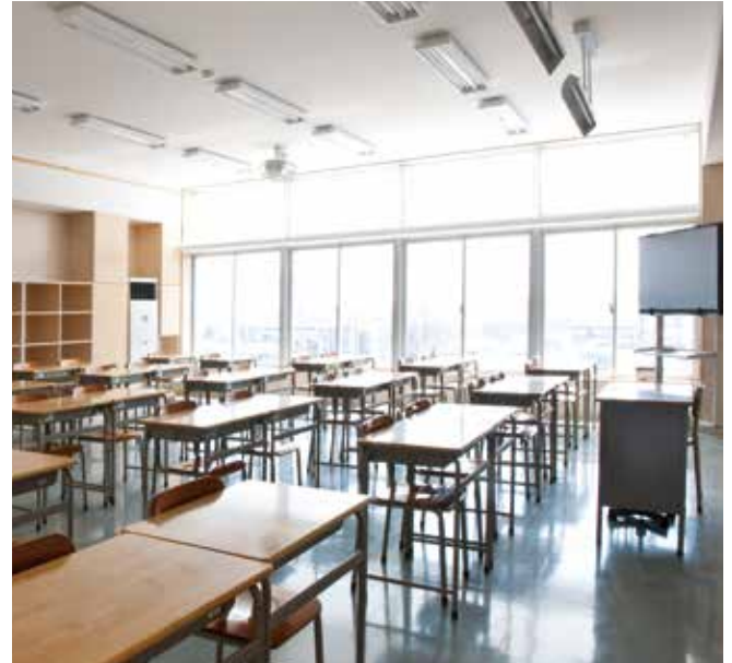
●横浜市立あかね台中学校(神奈川) スクールペアエコEA 設計:みかんぐみ 施工:小俣・六国・日成建設共同企業体