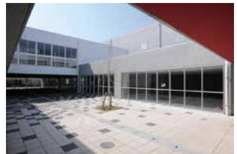
●横浜市立あかね台中学校（神奈川） 設計：みかんぐみ 施工：小俣・六国・日成建設共同企業体