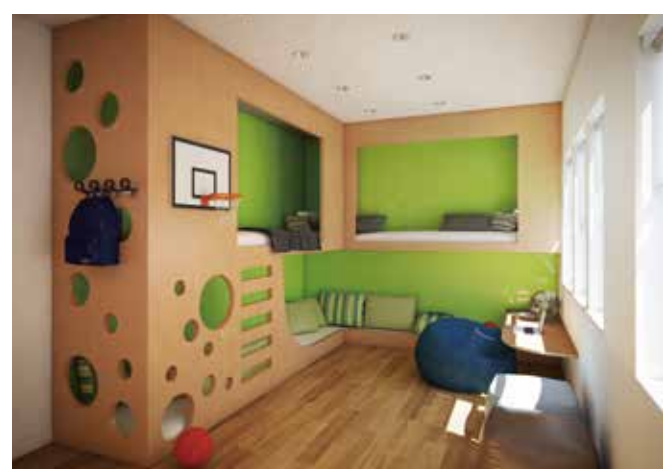
●子供部屋 落書き壁 ※壁面ライティングボード(SBG シャーベットグリーン)