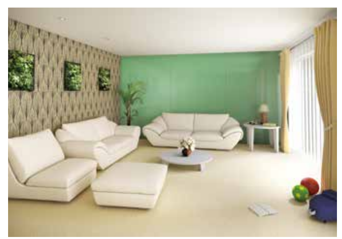
●リビング(FG3 アクアグリーン)