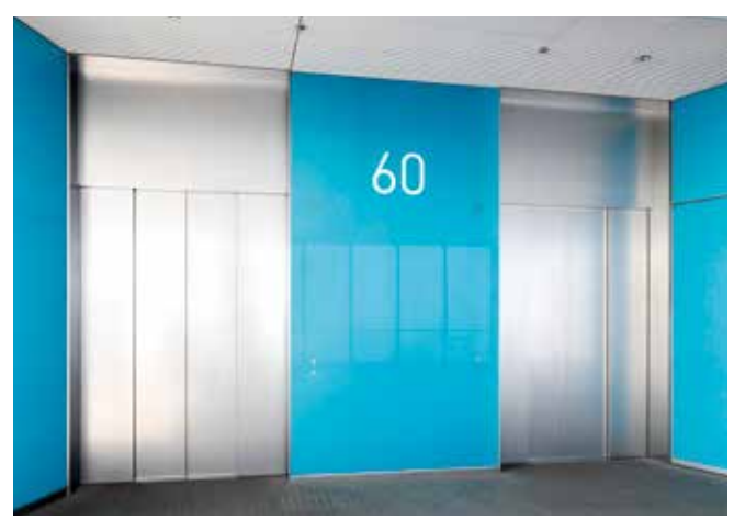
●あべのハルカス(大阪) 設計:竹中工務店 施工:竹中工務店・奥村組・大林組・大日本土木・銭高組共同企業体