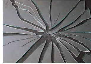
一般の板ガラスの破片