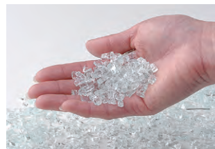
強化ガラスの破片