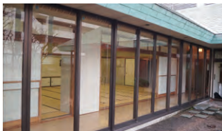
● 曳舟文化センター(東京)