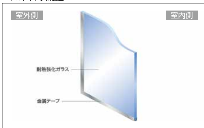
パイロクリアJ 構造図